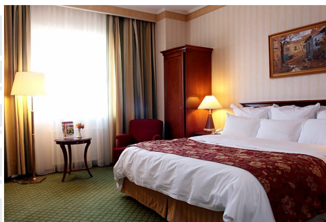
Фотографии номера «Делюкс» отеля «Ренессанс Самара»

В случае необходимости бронирования – обращайтесь к менеджеру проекта: Сантаевой Юлии по электронной почте manager_ya@uncm.ru или по телефону: +7 (495) 786-25-36