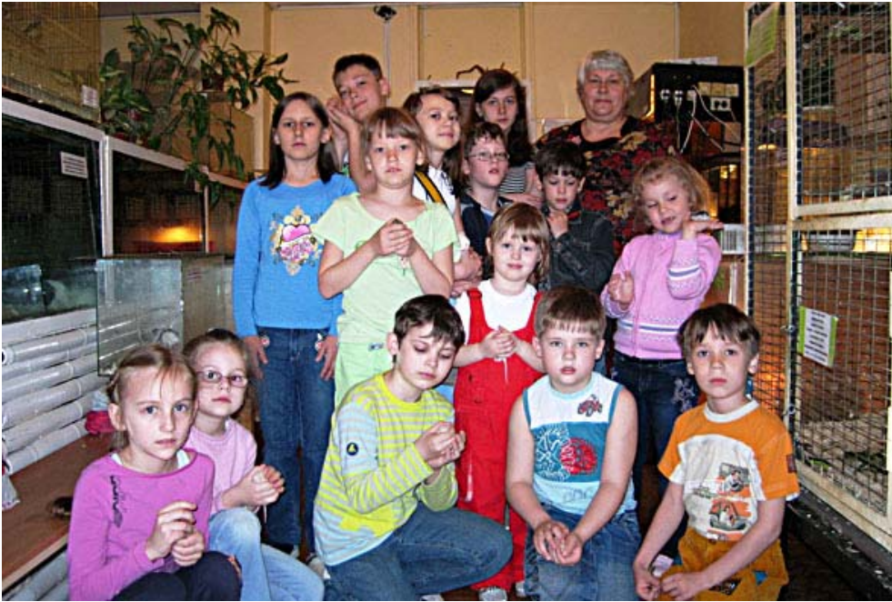
Занятие в Живом