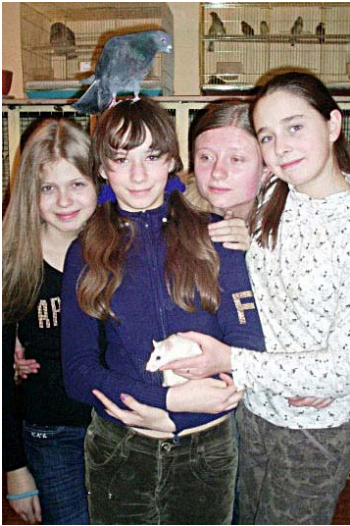
Занятия в Живом уголке