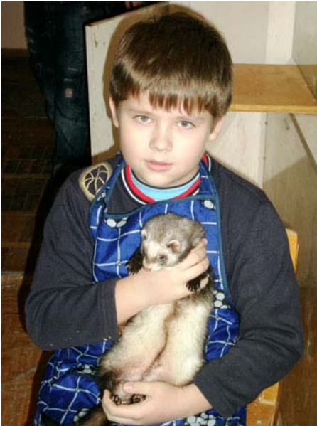
Занятия в Живом уголке с хорьком