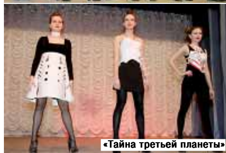
«Тайна третьей планеты»

Саяпиной студентки выполнили серию моделей одежды для детей дошкольного и младшего школьного возраста. Лёгкие рубашки, полоски отделочной ткани с рисунком, имитирующим народную вышивку, сразу напомнили зрителям о традициях русского костюма. Демонстрировали костюмы воспитанники модельной студии «Венеция» руководителя И. Чувараян.