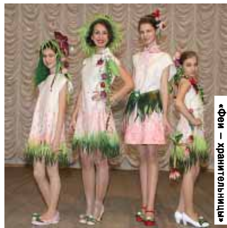
«Фей – хранительница»