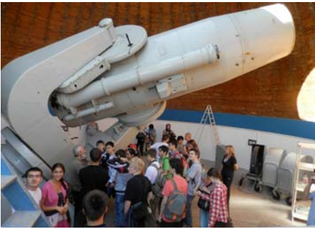
Участники XXI осенней астрономической школы в Бюраканской астрофизической обсерватории им. В.А. Амбарцумяна