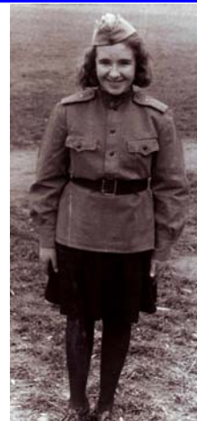
14 октября 1967 года. Перед марш-броском по «минному полю» во время военно-патриотической игры «Зарница».

ки, о том, какими глазами смотрели на меня мои одноклассники. Мую порцию большинством голосов передали самому маленькому (ростом), как потом